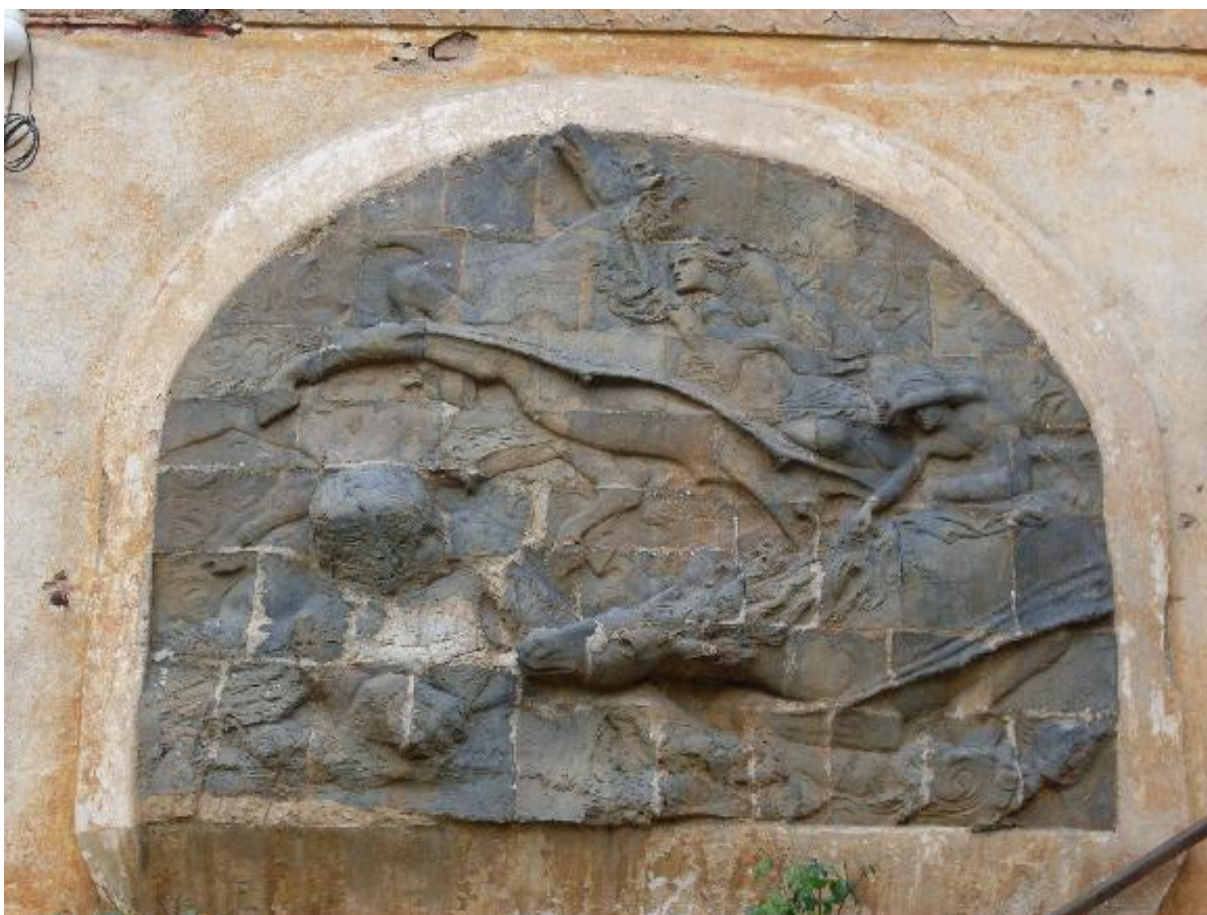
Reliéf Jak čas utíká.