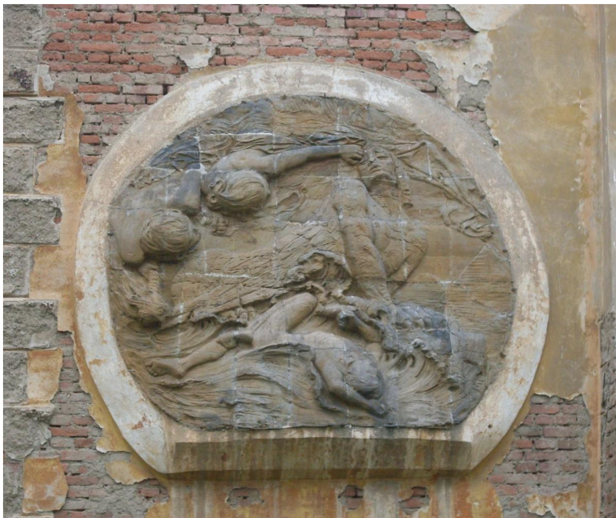
Reliéf Jak čas nám ryje vrásky.

a to ostatní, co bych s Vámi také ještě velmi ráda projednala ústně, až později, až se vrátíte z Itálie... Vy máte nyní, tak krátce před Vaší svatbou, jistě ještě všelicos na práci, také s přípravami na cestu do Itálie, tak Vám sotva zbude čas na tak velkou práci. Vzhledem k tomu, že vila je ještě hrozně nehotová a já dosud příliš nevím, jak budou vypadat vnitřní prostory, bylo by mi také milejší, kdybyste, milý pane Bílku, práce uvnitř budovy nechal až na později, kdy budeme mít oba více času a múzy, abychom to zvládli. Velmi mne, milý pane Bílku těší, že se svou mladou paní přijedete a doufám, že budete mými hosty..." [10].