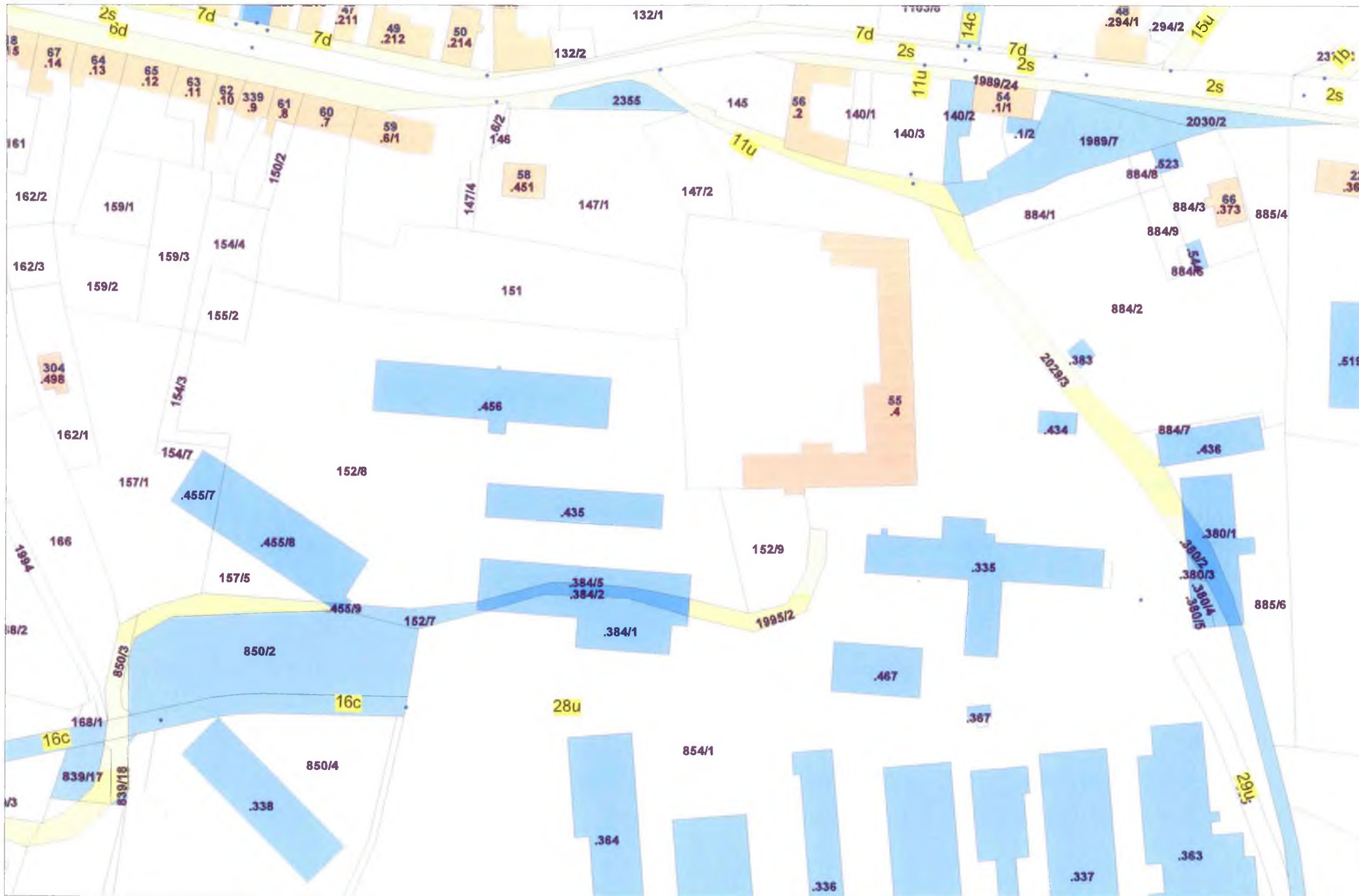
Mapa v měřítku 1:1500